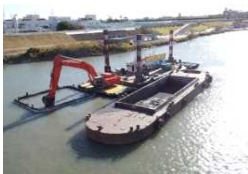
ICT しゅんせつ 浚渫工（河川）施工イメージ